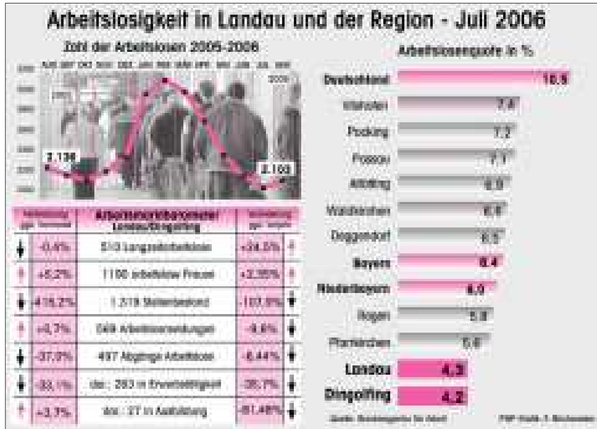
Die Arbeitslosenquote ist im Monat August im Altlandkreis Landau von 4,1 auf 4,3 Prozent gestiegen.

Da in der nächsten Zeit wieder ein Container nach Tansania geschickt wird, bittet die Caritas in Zusammenarbeit mit dem Laden aus zweiter Hand am Oberen Stadtplatz um Spenden. Es ist auch eine finanzielle Unterstützung möglich. Sie müsste auf die Konten der Caritas Landau bei der Sparkasse, Konto 5330, oder bei der VR-Bank Landau, Konto 19, unter dem Stichwort „Entbindung“ eingezahlt werden. Bei Angabe des Namens und der Adresse werden Spendenquittungen ausgestellt. Sachspenden können im Pfarrhaus in Großköllnbach, im Caritashaus in der Dr.-Godron-Straße oder im Laden aus zweiter Hand am Oberen Stadtplatz abgegeben werden.